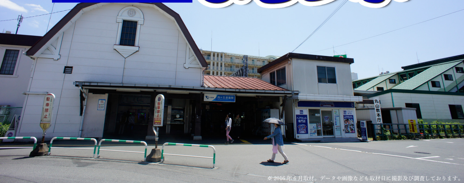
※2016年6月取材。データや画像なども取材日に撮影及び調査しております。

JR高尾駅より歩いて6分にあるプレミスト高尾スクラシテイ。大和ハウス工業が工業跡地に全416邸の分譲マンション開発を手がけ、2015年6月の初回販売にて100戸分譲予定を130戸に上積みしたにも関わらず即日完売した。その後も同年9月の第2期分譲、同年12月にカームコート・デライトコート第1期、今年3月にカームコート・デライトコート第2期共に即日完売という盛況ぶりを見せている。環境面では最寄り駅から程近い高尾山はミシュラン観光ガイドで三つ星を獲得し、外国人観光客にも人気の観光スポットとなっている。加えて、JR高尾駅は中央線の始発駅にもなっており、首都圏混雑率第4位の中央線（平成25年）を座って通勤通学できるというメリットは、始発駅が住環境の一つとして注目されるキッカケとなった。 今回のシリーズレポートでは、私鉄の始発駅に絞り街レポートを様々な確度からお伝えしていきます。初回である今回は小田急線の始発駅「向ヶ丘遊園駅」をレポート致します。向ヶ丘遊園駅は昭和2年に「稲田登戸駅」として開業、昭和30年に向ヶ丘遊園駅に改称しました。その後、名前の由来となった向ヶ丘遊園は平成14年に閉園し、現在に至ります。